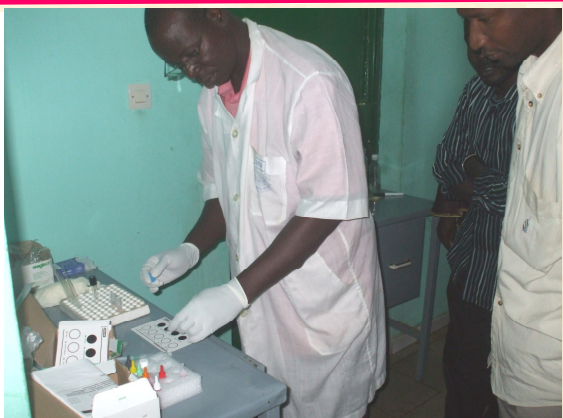
Séance de manipulation au laboratoire pour les tests recommandés (droite)