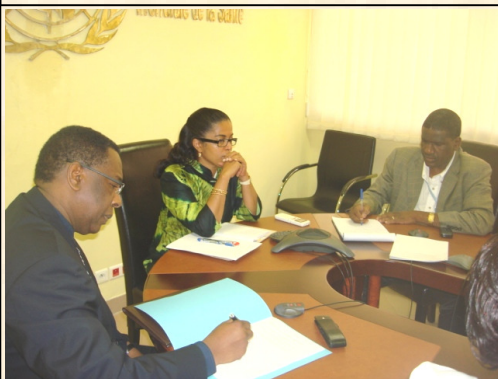
ILLUSTRATION DES ACTIVITES MAJEURES