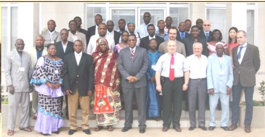
Le Coordonnateur de l'équipe inter-pays de l'OMS pour l'Afrique de l'Ouest (en veste au centre), pose avec les participants à l'atelier pharmaco vigilance tenu à Ouagadougou du 23 au 27 août (photo ci-dessus).