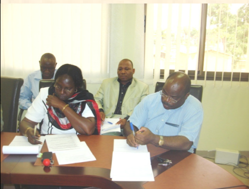
Tenue de la conférence téléphonique bimensuelle au niveau central (Ouagadougou) pour coordonner et suivre les préparatifs de la campagne dans les trois pays. (photos ci-contre)