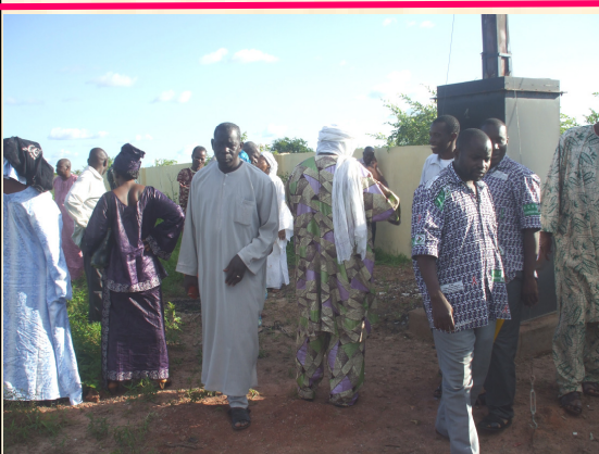
Visite d'un incinérateur dans la région sanitaire de Koulikoro au Mali (gauche).