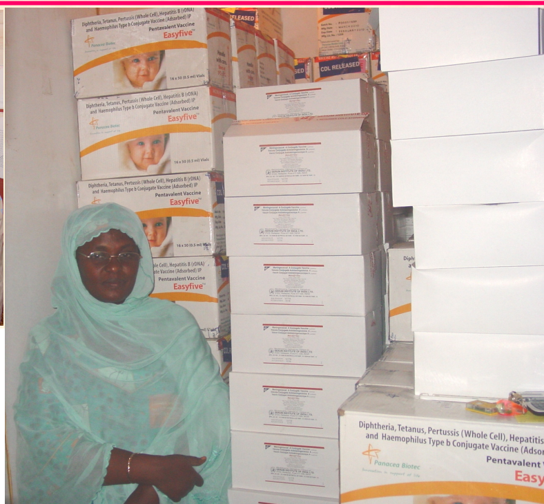
Stockage du vaccin MenAfriVac dans la chambre froide centrale à Niamey ci-contre (Niger)