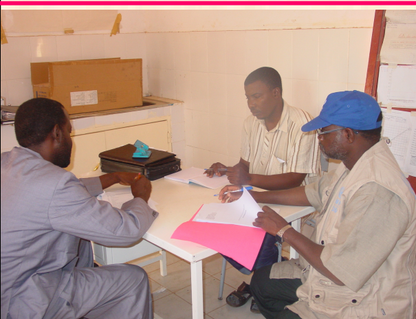
Mission d'évaluation du système de surveillance à Dosso (ci-dessus).