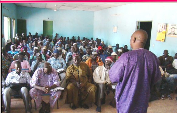
Forum communautaire à Fana (Mali). La communauté a été mise à contribution pour faciliter les actions de communication sur le terrain. (Photo à gauche)