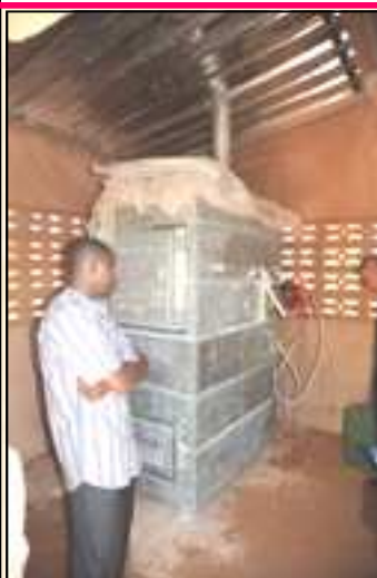
Incinérateur (ci-dessus), à Kaya, Burkina.