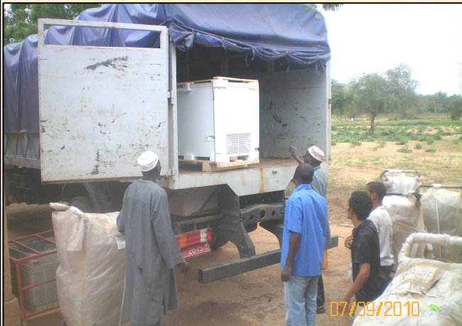
Chargement du matériel de la chaîne de froid et les incinérateurs au Niger (Photo ci-dessus). Ces équipements sont en partance pour les sites de vaccination du premier district (Filingué) retenu pour la première phase de la campagne avec le nouveau vaccin conjugué contre la méningite « A ». Ci-contre, réception des cartes de vaccination.